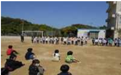
「一年生を迎える集会」