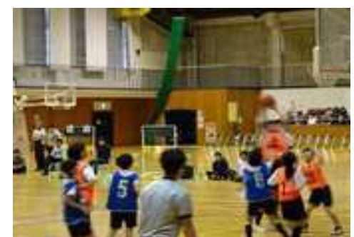
バスケット 女子 準優勝