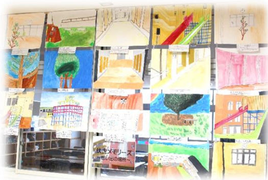
「あなたの思い出の場所は？」 6年生 伏虎メモリーズ