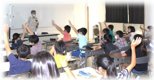
「副流煙の方に有害物質が多い」 6年生 喫煙防止教室