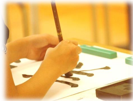
「心を落ち着けて」4年生 書写