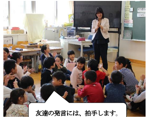
友達の発言には、拍手します。

授業後、行われた学級(学年)懇談会では、学級の子供の様子や子供を取り巻く環境について話し合いました。今回、6年生では、子供たちが学び始めた歴史学習の概要について学校から説明させていただきました。子供たちの豊かな心、正しい人権意識を育むために、これからも家庭と連携した人権同和教育の取り組みを進めていきます。