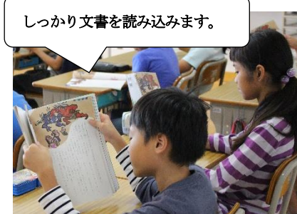
しっかり文書を読み込みます。