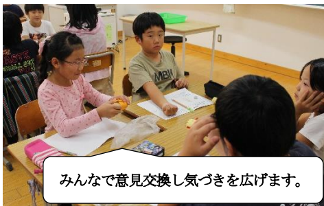
みんなで意見交換し気づきを広げます。