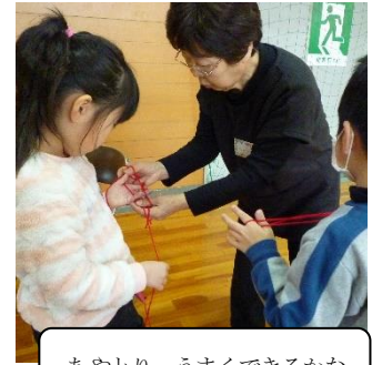
あやとり、うまくできるかな

子供たちを普段から見守ってくれている地域の皆さんの温かさを、あらためて知る良い機会になったと思います。ご参加いただいた皆さんに感謝申し上げます。