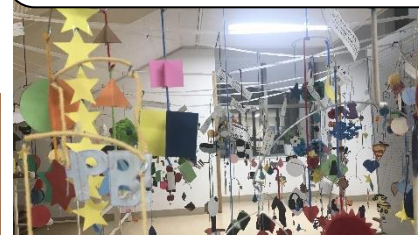
東階段下：9年生の美術作品「モビール」がずらりと並びます。