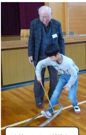
車輪ころがしに挑戦中