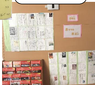
図書室：8年生のおすすめ本紹介が掲示されています。