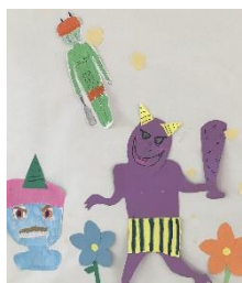
職員室前には季節の掲示(2月は「節分」)がされています