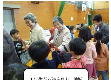
1年生が花道を作り、地域の皆さんを見送りました。