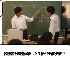
税務署を職場体験した生徒が出前授業中