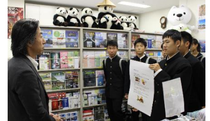
9年：「わかやま」の魅力を発信しました。