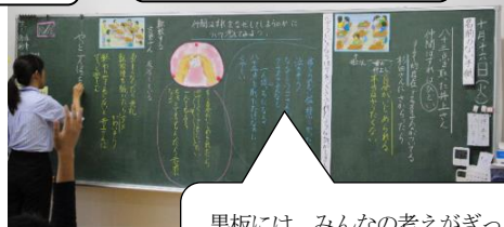
5年：名前のない手紙