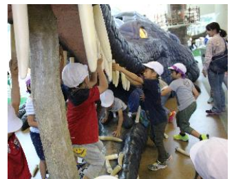
1年～3年：身体もしっかり動きました。

また、8年生は、10月17日(水)から19日(金)までの3日間、20か所で今年度の職場体験学習を行いました。9年生は修学旅行で、外務省や農林水産省を訪問するとともに、和歌山県東京事務所やアンテナショップである紀州館にて、わかやま創造科で取り組んだジビエについての学習を報告しました。