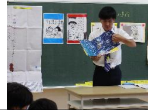
3年：ブッタとシッタカブッタ