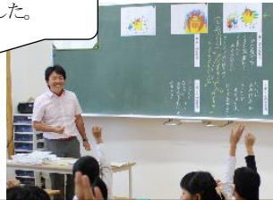
2年：くまくんはひとりぼっち