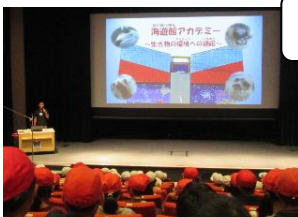
4・5年：発見がいっぱいありました。