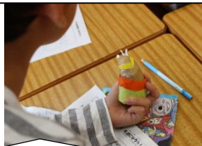
4年：ジャガイモさんと友達になろう