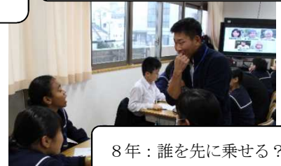
8年：誰を先に乗せる？