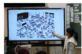
5年：いじめなんてしたくない