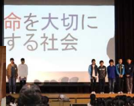
8年：和歌山の働くを学ぶ