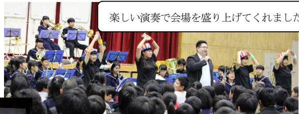
楽しい演奏で会場を盛り上げてくれました。