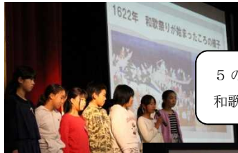
5の2：ぶらり 和歌山 旅めぐり