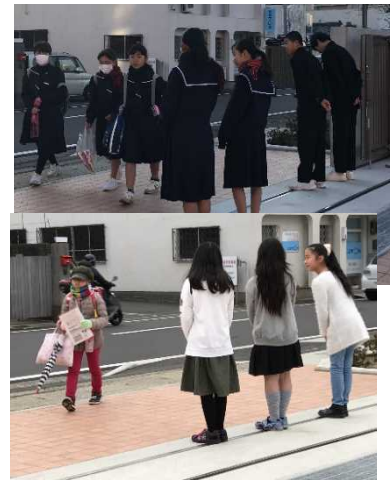
「おはようございます」の音が響きます。

あいさつには、互いの「心をひらく」大きな力があります。外は寒いですが、あたたかな空気が流れている朝の正門前です。