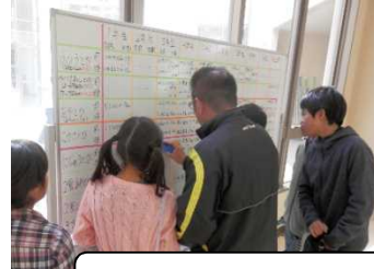
今日の最高記録を書き込んでいます。

に（先生枠もあり）それぞれ最高記録を記入しています。学年を越えて、ときには教職員も加わって競い合う姿も見られます。目標を持って体力向上に取り組む力を養うことができればと思います。なわとびが、本校の冬の校内風景なりそうです。