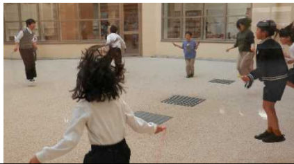
お昼休み中庭で、輪になってジャンプ！

現在、本校玄関には、なわとびのランキングを記入する「伏虎義務教育学校なわとびボード」