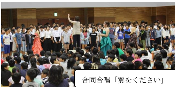
合同合唱「翼をください」

全校児童生徒による校歌斉唱の後、6年生から9年生が合唱団の皆さんと一緒に「翼をください」を歌いました。