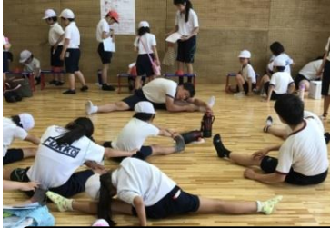
体をほぐして、前屈に挑戦

6月2日(金)、スポーツテストを全校で実施しました。本校で初めてのスポーツテストは、ペア(1年生と8年生、2年生と7年生、3年生と6年生のペア、4年生と5年生は学年内ペア)による移動、計測、9年生による全体運営と実技指導という形で行われました。いつも緊張から始まるペア活動ですが、一緒に各種目を回る