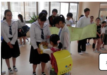
横断幕を作って募金を呼びかけました。

各委員会の活動が始まり、校内の様々な場面で活躍中。みどりの羽根募金に取り組んでいるボランティア委員会、朝のあいさつ運動に取り組んでいる風紀委員会、昼放送を始めた放送委員会、校内の掲示にも各委員会の工夫が見られます。順次取組を紹介します。